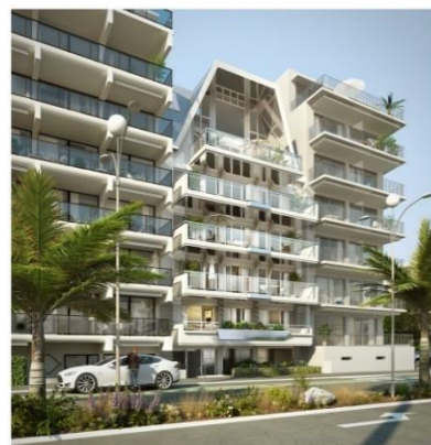
VILLA DARLU La Baule (livraison 2 ème T. 2019) 7 logements