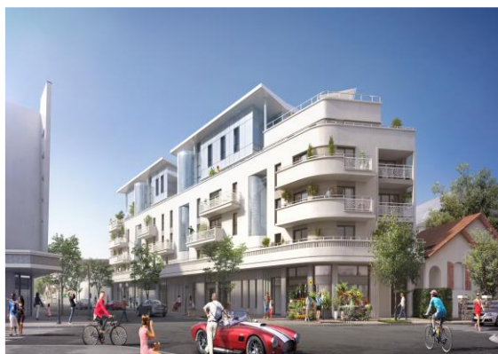
VILLA VICTOIRE La Baule (livraison 1 er T. 2019) 64 logements 2 commerces