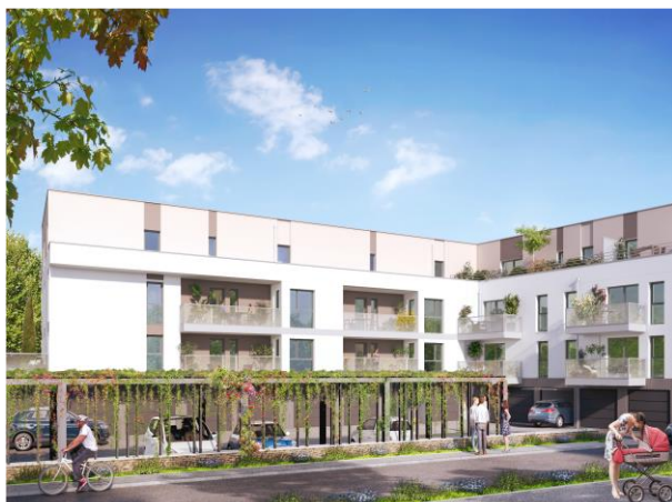
Vue sur les parking et la façade Nord / Est