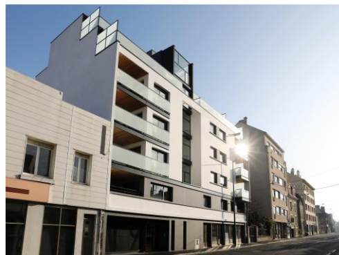
N°9 RENNES (2016) 22 logements 2 plateaux de bureaux