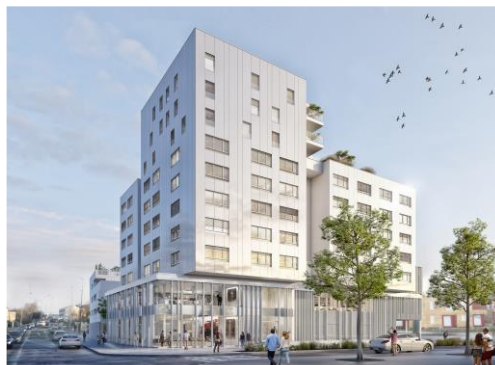
MY CAMPUS RENNES (2017) 127 logements