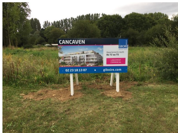
Panneau de commercialisation sur site