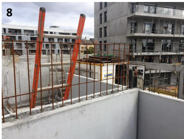
8. Zoom sur le ferrailage intérieur (armatures) des parois en béton