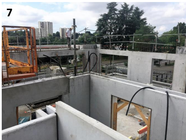
7. Murs préfabriqués du 1 er étage