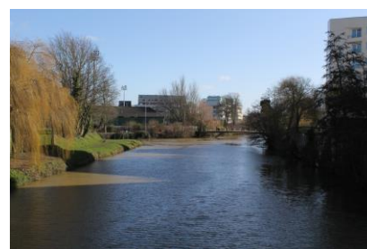
Bords de la Vilaine

EUROSQUARE est situé dans le « village Saint-Hélier » et à proximité du centre historique de RENNES. Il bénéficie d'un cadre de vie privilégié grâce à une vraie vie de quartier : nombreux commerces et équipements (écoles, lycées, Théâtre National de Bretagne, gare de Rennes) et des lieux de repos et de détente au bord de la Vilaine.